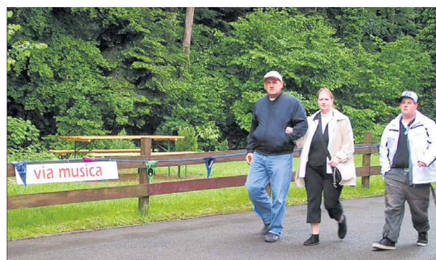
Lud wegen des schlechten Wetters nicht unbedingt zum längeren Verweilen ein: Die «Via musica» ins Schulhaus Weid. (spa)