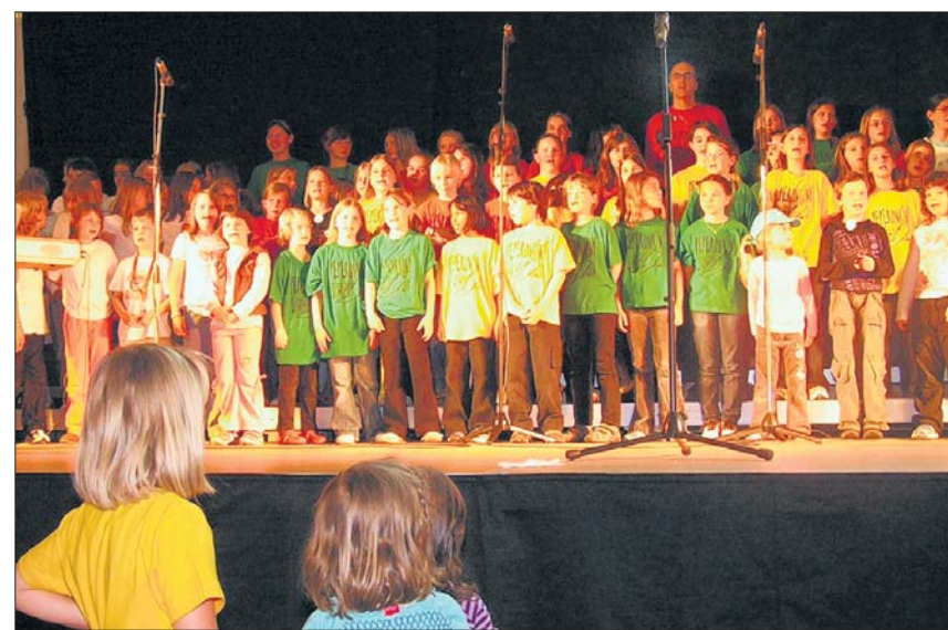
Dieser bunt gemischte Chor erntete bewundernde Blicke vom Bühnenrand. (sch)