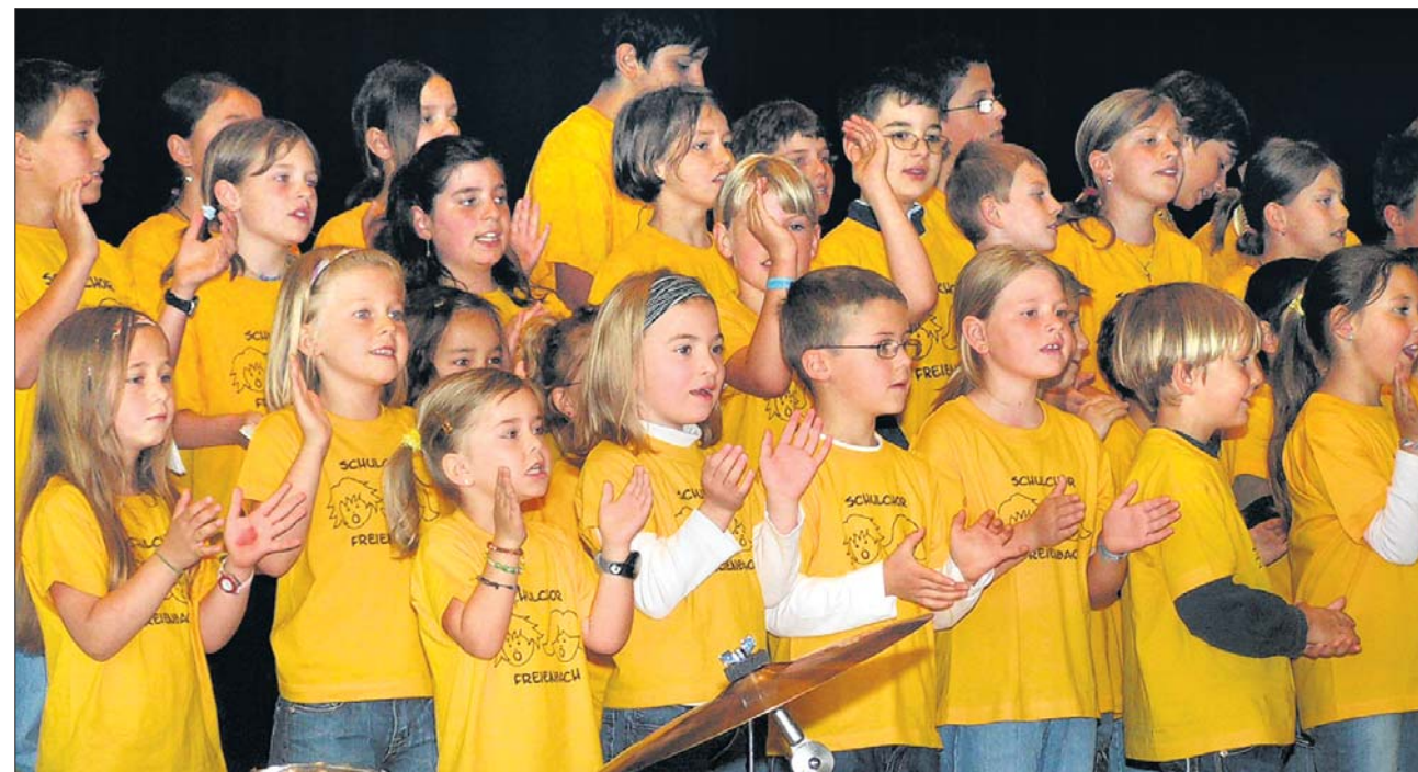
Klatsch, klatsch, klatsch: Der Schülerchor Freienbach riss das Publikum mit flotten Rhythmen mit. (spa)