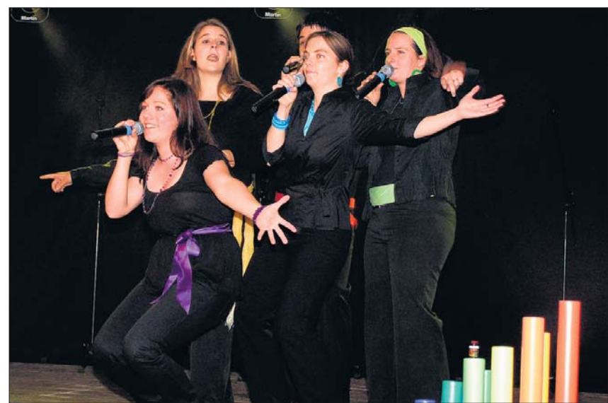
Hatten ein «Heimspiel» am A-cappella-Festival: Die «whacky tunes». (spa)