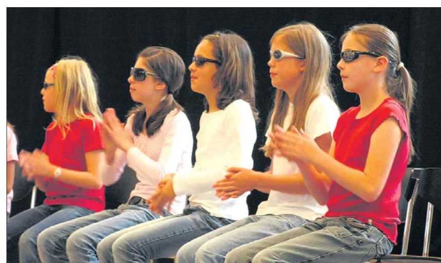
Nicht zu unterschätzen: Die Wahl der richtigen Requisiten für den Auftritt. Stilsicherheit bewiesen diese Sängerinnen aus der Obermarch. (spa)