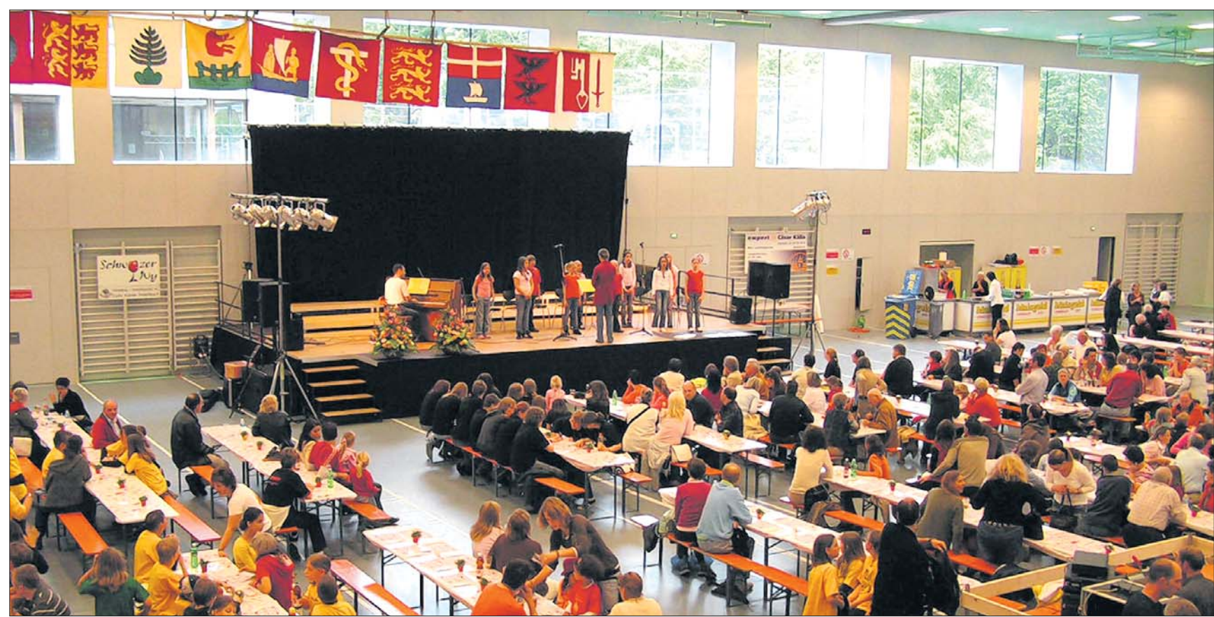
Bühne frei für die jungen Sängerinnen und Sänger: So manche stolzen Eltern zückten den Fotoapparat, als ihr Sprössling auf der Bühne stand. (spa)

Pfäffikon Schwyzer Singfestival mit Auftritten von Kinder- und Jugendchören eröffnet